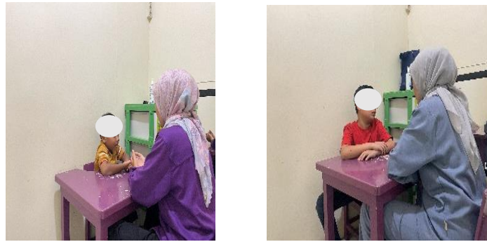
Gambar 2. <Pelaksanaan Terapi Wicara>

Tindakan yang dilakukan oleh terapis mencerminkan strategi adaptif dalam menjaga keterlibatan anak selama proses terapi. Terapis menunjukkan adaptasi terhadap lingkungan fisik agar anak tetap nyaman dan fokus selama terapi.