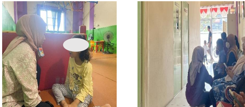
Gambar 3. <Komunikasi Terapi Kepada Orang Tua>

Terapis memberikan hasil perkembangan terapi melalui buku komunikasi terapi dan kemudian terapis juga menjelaskan kembali hasil terapi secara langsung kepada orang tua, serta memberikan laporan dalam bentuk lampiran surat mengenai perkembangan hasil terapi anak 1 kali dalam 3 bulan. Manager operasional juga menyatakan bahwa orang tua terlibat dalam proses terapi. Karena orang tua memiliki peran penting dengan memiliki kerjasama yang baik, komunikasi yang baik, kemudian penerapan program yang baik yang disampaikan oleh terapis kepada orang tua sehingga proses atau perkembangan anak menuju ke arah yang lebih baik menjadi lebih optimal. Dengan terapis menjalin hubungan yang baik dengan orang tua serta membangun interaksi sosial anak dengan teman sebaya, menggambarkan sebagai bentuk adaptasi sosial yang mendukung keberlanjutan kerja dan proses terapi.